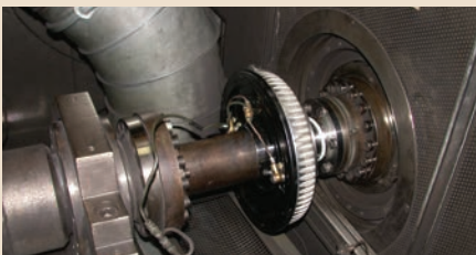
Simulation des Bremsvorgangs