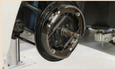
Am Fahrzeug montierte Bremsbacken