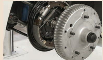
Montage der Bremstrommel