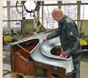
Zuschnitt des Serienteils