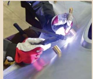
Zusammenheften von Seitenteil und Kotflügelverbreiterung