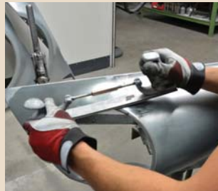
Finish der Schweißnaht